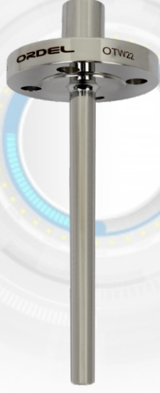
OTW22 Flanşlı Konik Tip Termoveller