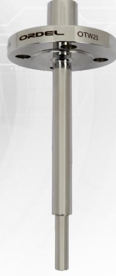
OTW23 Flanşlı Kademeli Tip Termoveller