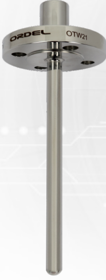
OTW21 Flanşlı Düz Tip Termoveller